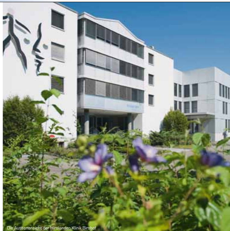
Die Aussenansicht der Hirslanden Klinik Birshof