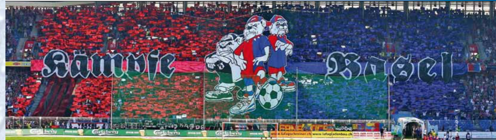
Die «Muttenserkerve» im St. Jakob-Park

«Geschäftsführer»: Sie haben nun die zehn erfolgreichsten Jahre in der Geschichte des FC Basel hautnah an verantwortlicher Stelle miterlebt, ist man sich innerhalb des Clubs überhaupt bewusst, was hier in den letzten zehn Jahren passiert ist?